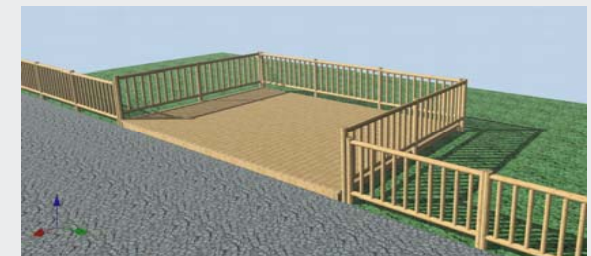
Detalle del mirador